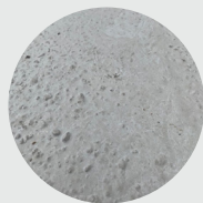
Tiré à la règle